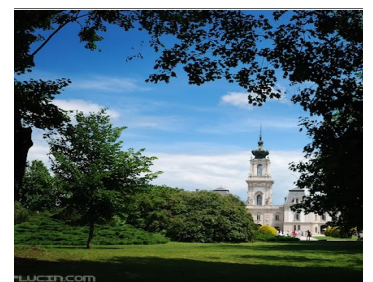
Slottet Festetisc i Keszthely - nabobyen

Vi tar forbehold om endringer som er utenfor vår kontroll i forbindelse med turen, samt tillegg dersom vi splitter ut billett til og fra en annen flyplass. Ellers tar vi forbehold om ruteendringer, forsinkelser, økning i flyavgifter, oljetillegg og valutakurser i 2017.