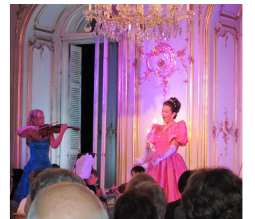
Operettekonsert i Festetisc

Day 9. Onsdag 19. april Budapest - Stavanger Kl.07.-09.00 Frokost på hotellet og avreise til Budapest. Kl.09.00 Turen går tilbake til Budapest for hjemreise med Norwegian via Oslo. Kl.13.30 Flyavgang via Oslo til Stavanger med Norwegian. Kl.16.00 Lander vi i Oslo og handler taxfree før vi tollklarerer og dra videre 18.15 til Sola. Kl.19.05 Ankomst Stavanger og vel hjem.