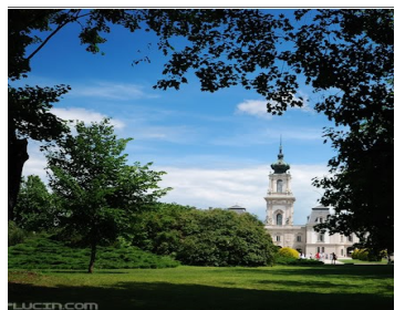
Slottet Festetisc i Kesztheley - nabobyen