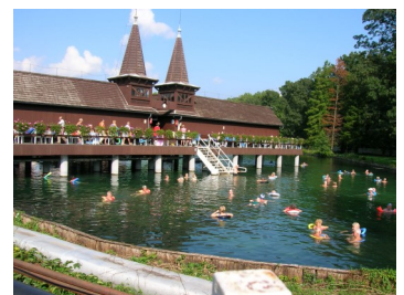
Utendørs bade temperatur i Héviz-sjøen