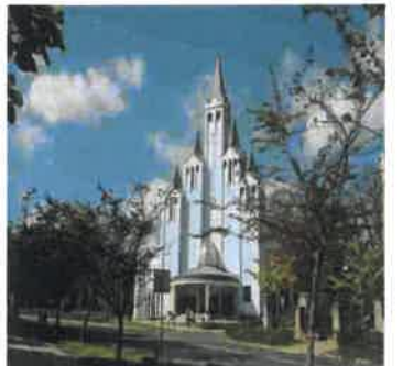
Hévíz katolske kirke.