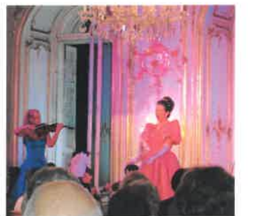
Operettekonsert i Festetisc