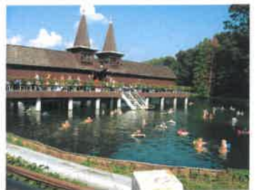
Utendørs bade temperatur i Hévíz-sjøen