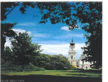
Slottet Festetisc i Kestheley - nabobyen