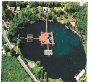
Héviz sjøen fra fly foto