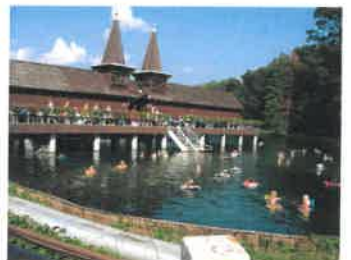
Bade temperatur i Héviz-sjøen fra 26 utendørs til 34 grader innendørs