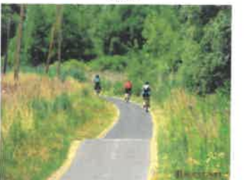
Sykkelsti langs Balaton