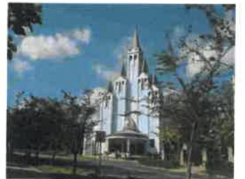
Héviz katolske kirke.