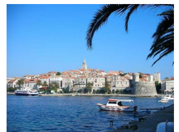
Korkula Marco Polo's fødeøy