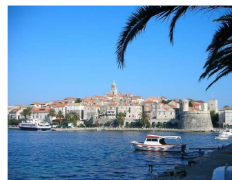
Korkula Marco Polo's fødeøy