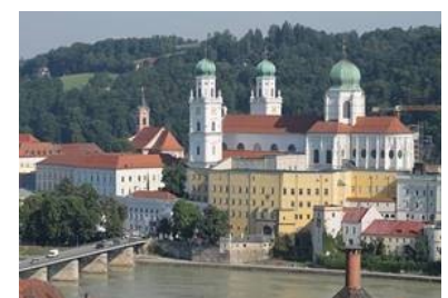
Passau Dom St Stephen