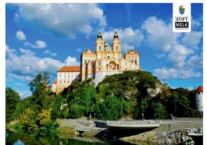
Klosteret i Melk

Vi må ta forbehold om endringer utenfor vår kontroll. Det være seg flyruter, ruteendringer, ending i valutaendringer, avgifts- og oljetillegg for 2020. Grunna særskilte regler og båtkontrakt med Croise Europe for arrangementet kjøpt hos våre samarbeidspartnere mister en uansett depositum. Avbestilling av tur kan hver og en søke hos sitt eget forsikringselskap.