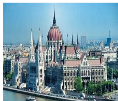
Budapest - Donaus Dronning

Dag 5 Søndag 21. juni MELK - PASSAU TYSKLAND Kl.08.00 Vi spiser frokost, mens vi seiler den vakreste delen av Wachau-dalen og ankommer etter hvert byen Melk. Vårt forslag er utflukten til Durnstein , en festningsby hvor Richard Løvehjerte var fange. Kl.13.00 Lunsj på båten, før avreise til Klosteret i Melk , den flotte barokkbygningen som kneiser på høyden over byen og elva. Klosteret ble bygd som palass mellom 1702 og 1736. I dag er dette et aktivt Benediktinerkloster med 900 elever, som bor på internat og går på skolen. Denne studieplassen er svært anerkjent. Vel tilbake på kvelden starter vi vårt cruise videre til imot Passau, som er grenseby MOT Tyskland. Elvene Inn og IIs møter her Donau elven, som kommer fra Schwartz Wald og renner gjennom Tyskland. Gallamiddagen er i kveld - og vi nyter denne siste kvelden om bord. Etter middag gleder vi oss til felles hygge i skipet`s bar sammen