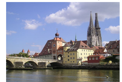
Regensburg ved Donau