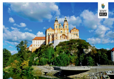
Klosteret i Melk