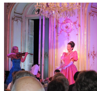
Operettekonsert i Festetics-slottet