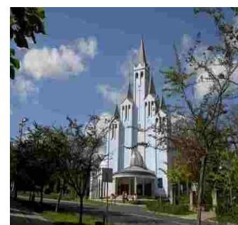
Héviz katolske kirke