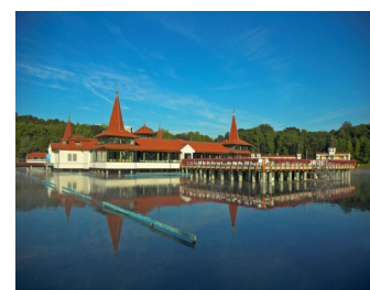
Utendørs bade temperatur i Héviz-sjøen om vinteren ligger mellom 26 og 28