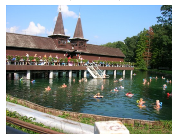
Bade temperatur i Hévíz-sjøen fra 26 utendørs til 34 grader innendørs