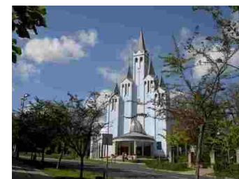
Hévíz katolske kirke.