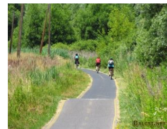
Sykelsti langs Balaton