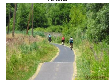
Sykkelsti langs Balaton