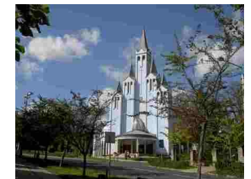
Hèviz katolske kirke.