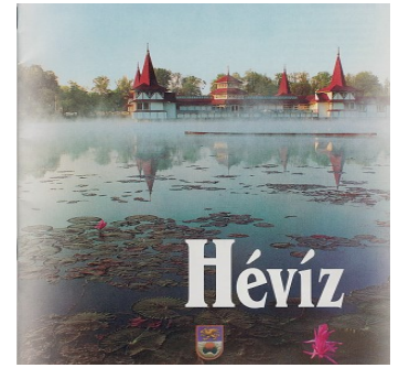
Vannliljene i Hèviz sjøen

DAG 4. Torsdag 20. september BADASCONY - KESZTHELY - HÈVIZ - KONSERT Kl.07.-09.00 Frokosten inntas før vi pakker sekken vår for siste sykkel dag langs sjøen. Vi besøker slottshagen på Festetics Slottet, der Europas første landbrukskole ble etablert i Keszthely og tar en lunsjstopp og sjekk på butikkene i byen før vi fortsetter til den flotte kurbyen Hèviz. Innsjekk på Hotel Erzebeth og avlevering av våre sykler. Kl. 18.00 Jentene samles til felles middag og Kl. 19.10 Avreise til konsert i Kesthely Slott. Kl. 22. 30 Tilbake på hotellet.