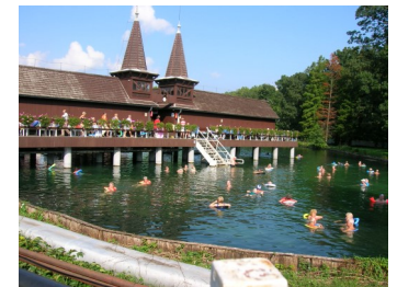
Bade temperatur i Hèviz-sjøen fra 26 utendørs til 34 grader innendørs