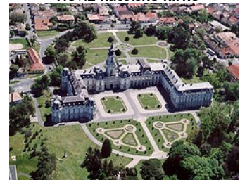
Keszthely - Festetics Slott