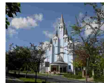
Hévíz katolske kirke