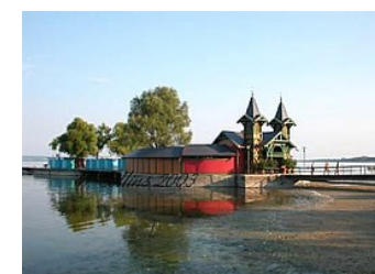
Bro ved Balaton sjøen