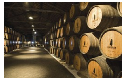
Portugal er portvinens hjemland