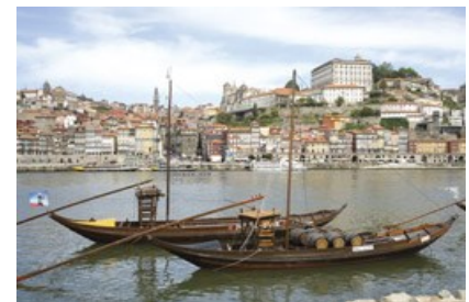
Tønnetransport på Douro-elven