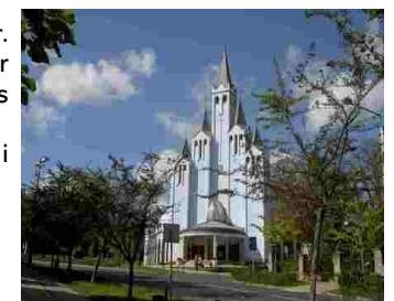
Hévíz katolske kirke