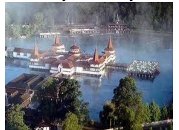
Termalsjøen 26 til 34 grader