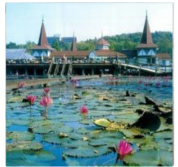
Vannliljene i Hévíz sjøen

Kl.07.-10.00 En rolig dag med frokost på hotellets restaurant. Kl.10.00 Om mulighet finnes for stor nok gruppe kan vi oppleve hesteshow på Radspusta. Vi tar forbehold om at det er kunder nok til at denne stallen fremfører denne fantastiske underholdningen. Er det mulig på dagtid inkl. vi lunsj i restauranten inkl. drikke. Kl.19.00 Middag på hotellet