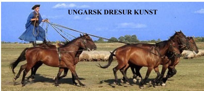
UNGARSK DRESUR KUNST