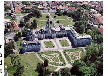
Keszthely - Festetics Slott