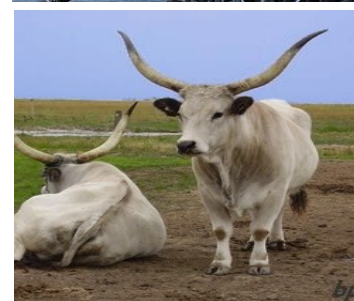
Mengalica ungarsk gris