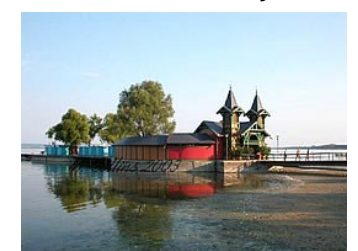
Bro ved Balaton sjøen