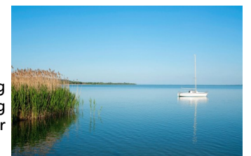
Balaton - bilde fra sjøen