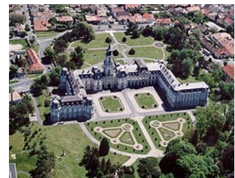
Kestelej - Festeticz Slott