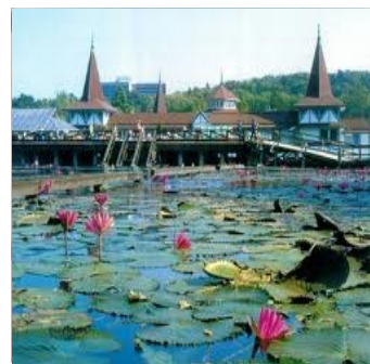
Vannliljene i Hévíz sjøen