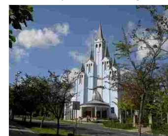
Hévíz katolske kirke