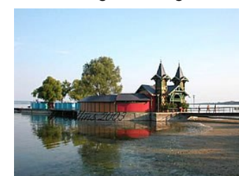
Bro ved Balaton sjøen