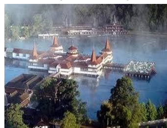
Termalsjøen 26 til 34 grader