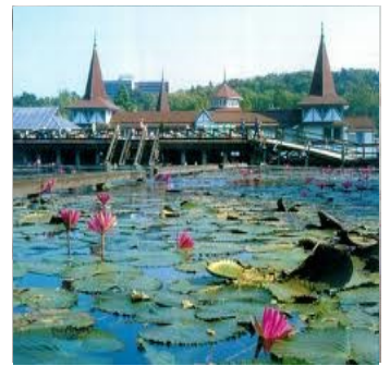
Vannliljene i Hévíz sjøen

Kl.07.-10.00 Etter frokost nytes dagen i denne kjekke småbyen. Her kan en gå på bading i den deilige Termalvanns innsjøen i Hévíz. Ved kjøp av inngang inkluderes opphold i 3 timer- solsenger er da mulighet å benytte for den som ønsker det. Ellers er Hévíz en hyggelig by å bli kjent med. Her er masser av butikker, frisører, sølvmeder om en skal reparere noe, klokkebutikker ( batteri skift ) SPA og velvære. Ellers inviterer reiseleder tur / vandretur, sykkelturner for de som vil det. Vi studerer hvordan lokalbefolkningen bor, hører om dagens utfordringer for de ungarske borgere som har et vanskelig språk som tilhører finsk - urgisk språkgruppe og som er svært vanskelig å lære. Plass for både forfriskning og lunsj finns på mange. Kl.18.00 Middag på hotell i Hévíz og Kl. 19.00 reiser vi til konsert i slottet Festeticz.