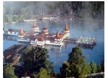
Termalsjøen 26 til 34 grader