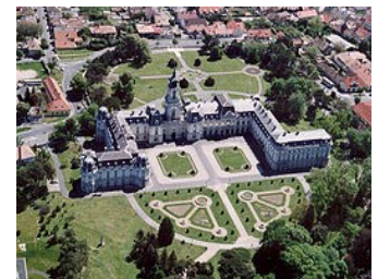
Kestelely - Festeticz Slott