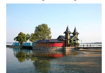
Bro ved Balaton sjøen